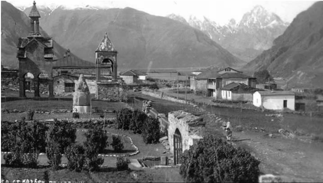
ალ. ყაზბეგის სახლ-მუზეუმის ეზოდან

მითხრა, მე მამკალ, სიკვდილო, ობლობა მემეწყინაო. შენ როგორ მაგკლავ, ობოლო, შენი დამტირე ვინაო. არცა გაქვ სანთელ-საკმელი, არც სუდარაი შინაო. ცხრა ძმანი გადიდებულან, მინდა ჩაუდგე წინაო. ცხრანივ თავთავად გავხყარნა, თავთავად მივსცა ბინაო.