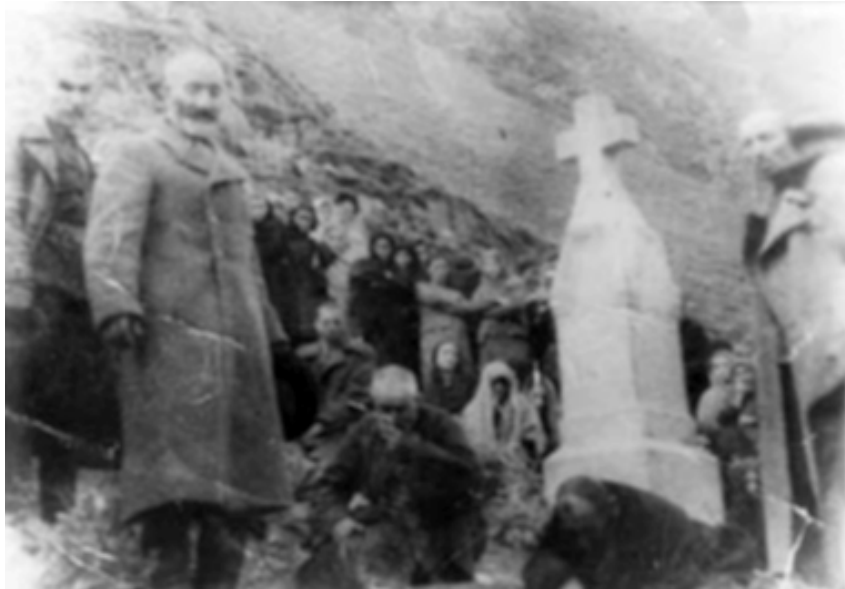
მოსისხლე გვარების შერიგება მოკლულის საფლავზე

ახოს მთა გადაიარა, შუქია პირიმზისაო. პირიმზის ნიშთან გახედა, ხოხორი მაისმისაო, ნაპირზე იდგა მხვეწარი, ხალხია ყველაი მკრისაო, ხალხმა შახედა გოგოლის, რა ეფხვი ჩადის ძირსაო. იქ სადმე დახედეს კემსურნი, ხკითხეს ამბოვი გზისაო: - საით მიზდისხარ, ძმობილო, წოვანთ თუშების მკრისაო, მგონია, გინდა ის კაცი, მამკლავი შენის ძმისაო. თუ ხფიქრობთ შარიგებასა, ტეტიკაი ძვირად ღირსაო. ტეტიკაის მაგონებაზე გიგოლის სისხლი დუღსაო.