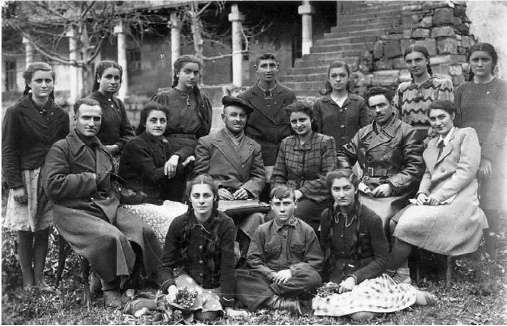
ყაზბეგის მხარეთმცოდნეობის მუზეუმის ეზოში