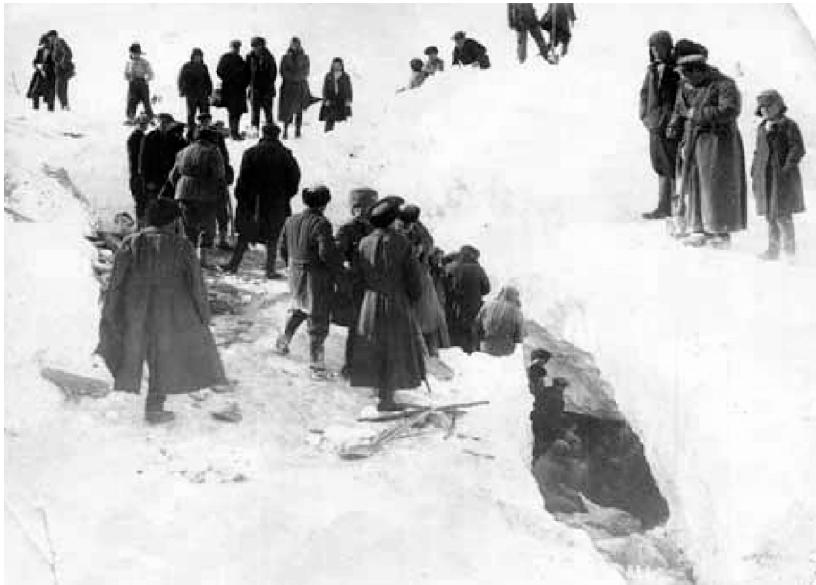
ფანშეტლების ზარალიანი ზამთარი

სამი ვაშლი მქონდა და დავარიგე: ერთი მქნელსა, ერთი მოქმელსა და ერთი გამამგონებელსა.