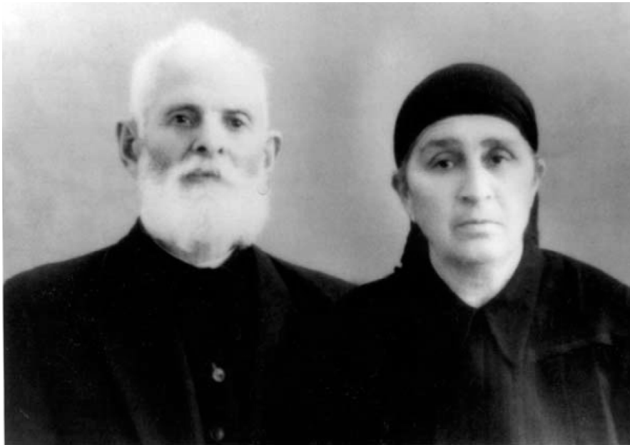
უწმიდესისა და უნეტარესის, სრულიად საქართველოს კათოლიკოს-პატრიარქის ილია II-ის მშობლები: გიორგი შიოლაშვილი, ნატალია კობაიძე-შიოლაშვილი.

მოუკლავ ჩემი ქმარია, მე ვერ გადუყრი ობლებსა, ჩიეთ გაგაის ქალია. ან როგორ გადავივიწყა სახელოვანი მკვდარია, ცის ერაპლანი მოვიდა, ნაპოცს გადავლა თოლია. იქ ნახეს გოდერძიშვილი, უკუღმა ბრუნავს ქარია. სად გაიზარდე, ვაშკაცო, სადა გყავ დედ-მამანია, ან როგორ დასთმე სამშობლო, დიდი ყაზბეგის მთანია.