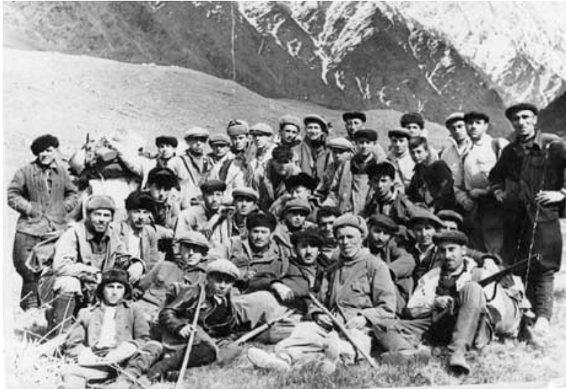
ლაშქრობა ყუროზე (XX ს. 50-იანი წლები)