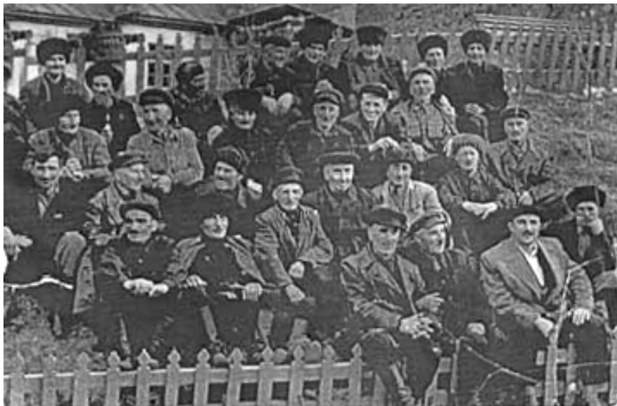
აღ. ყაზბეგის ძველის გახსნაზე

ანგელოზია ცისაო, ათასი ჯარი გამახყვა, სწორები ერთის ხნისაო მაღალო ყაზბეგის მთაო, გადამხედველო ჭდისაო, თოვლიან-ყინულიანო, გრილი ნიავი ხქრისაო. მანდ ერთი წყარო გადმოდის, ნაწკლეტი არის ზღვისაო. სნოს ციხეც, კლდეზე დადგმულო, ძველთა მამათა უმისაო, ჩასძახე გორეულობით შიოლაის შვილის შვილსაო. გიკვდებათ თქვენი ილიკო, ვაშკაცი დიდის ჭკვისაო, ჩალხი უკუდმა დაბრუნდა, მასკვლევი დაკრთა ცისაო. ჩალხმა დოგიკრა ილიკოს ფიცარი გულის პირსაო. მოწმად შეესწრო სიკვდილი, ამრევი მაგის გზისაო. ატირდა გორეულობა, მღუღარე ცრემლი ზდისაო,