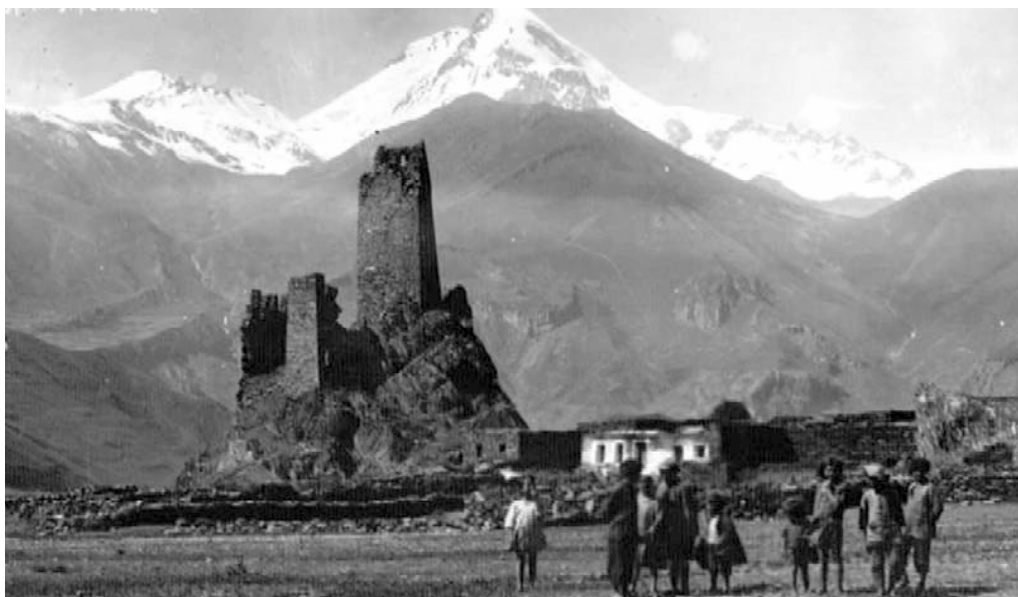
სნოვლები და სნოს ციხე