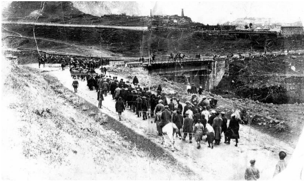
„კობათ ხიდი“ სოფელ სიონში